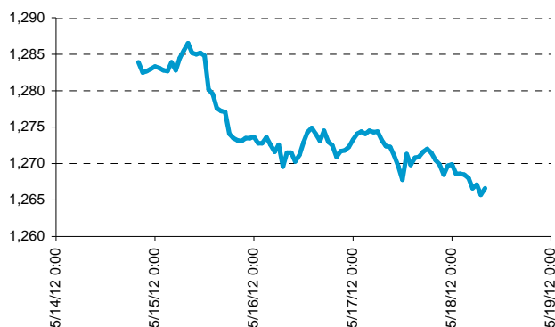
EUR/USD, posledních 85 hodin.