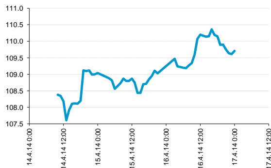
Brent (USD/bbl), posledních 55 hodin.