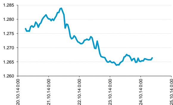
EUR/USD, posledních 100 hodin.