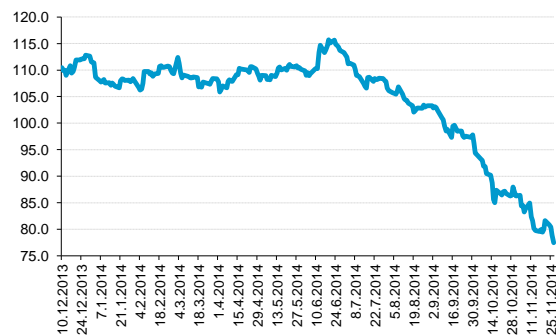
Brent (USD/bbl), posledních 250 dnů.